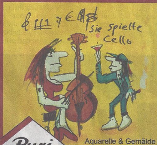
Aquarelle & Gemälde